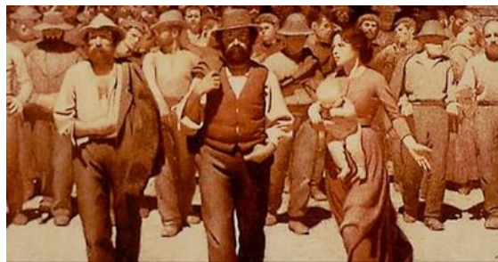
donna che vergognosamente strumentalizza un bambino per una protesta politica